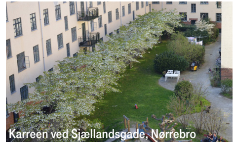
Karreen ved Sjællandsgade, Nørrebro

Et eksempel på en gårdhave med lige linjer og geometriske former. Der er mange typer af belægningsmaterialer der spiller sammen på forskellig vis. Her er der intime opholdsarealer nær bagtrapper og kantzonen nær lejlighederne.