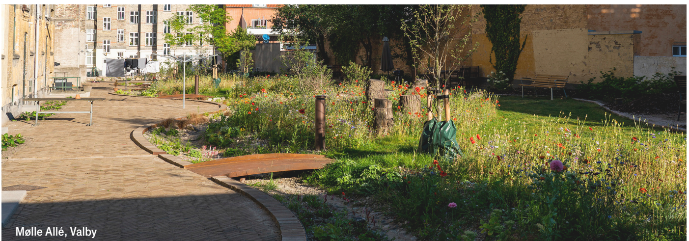
Mølle Allé, Valby